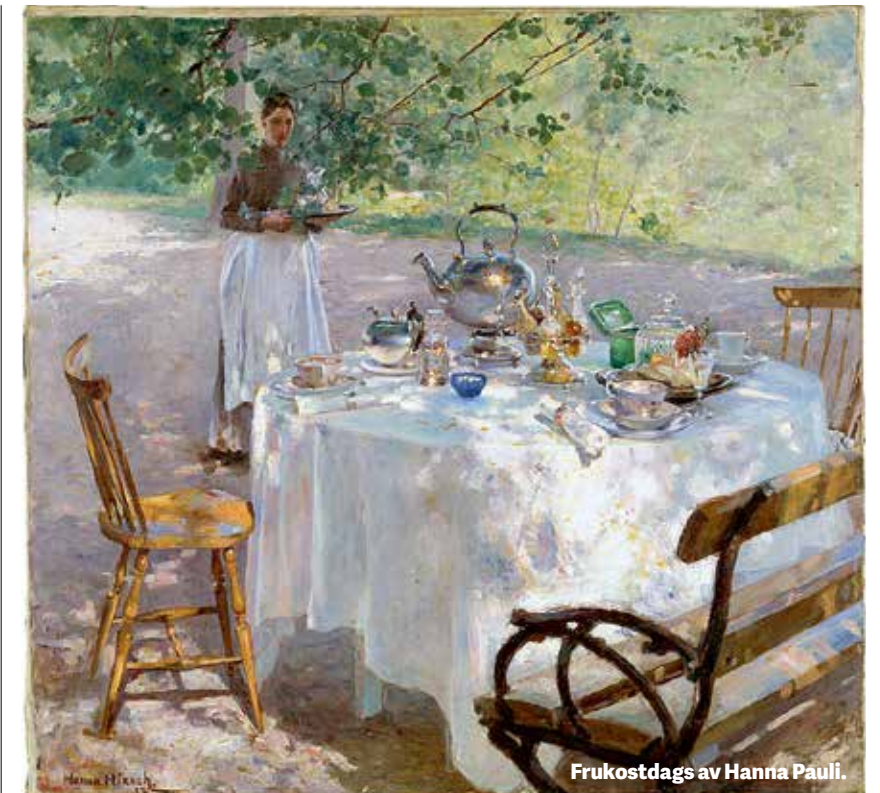
Frukostdags av Hanna Pauli.

Det är vi som tittar tillbaka på de här motiven med nostalgi, men då var det det senaste och så radikalt att man var tvungen att vänja ögat vid vad det var